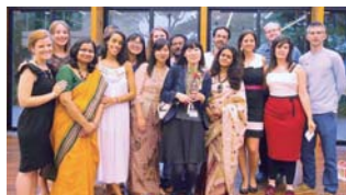
国際基督教大学 第13期生の修了式 (2016年6月)

世界に6つあるロータリー平和センターの1つで、国際関係・平和・紛争解決とその関連分野の修士号あるいは平和と紛争解決分野の専門能力修了証の取得を目指す学生に奨学金 (US$4 万ドル以上) を提供するプログラムです。候補者は修士号と関連分野における職務またはボランティア経験が必要となります。英語に堪能であること、更に平和と国際理解への明らかな熱意が必要となります。毎年、世界で50名のフェローが選出されます。