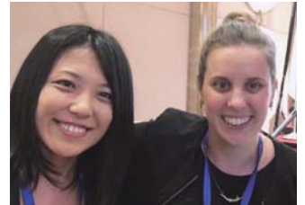
2015-16年度 香港城市大学で学ぶロータリー財団奨学生