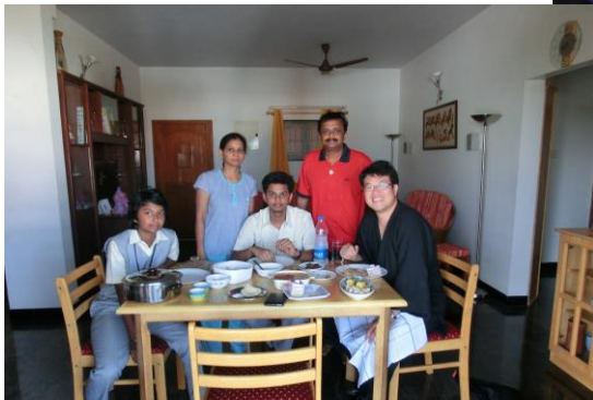
マドライのアナンダファミリー