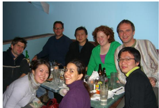
学習会の同士と授業の打ち上げ