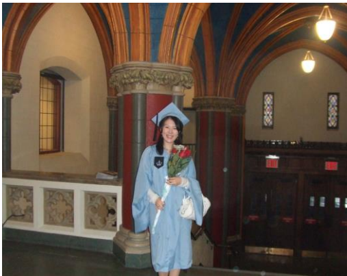
卒業の日に校内で

今回、本稿の執筆を頼まれたが、留学をもとにしたカッコいい話は書けない。でもやはり、ロータリーの目指す世界平和のために自分は働いていると、私は思う。