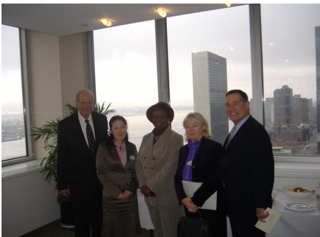
ロータリーの例会にて（後ろは国連）